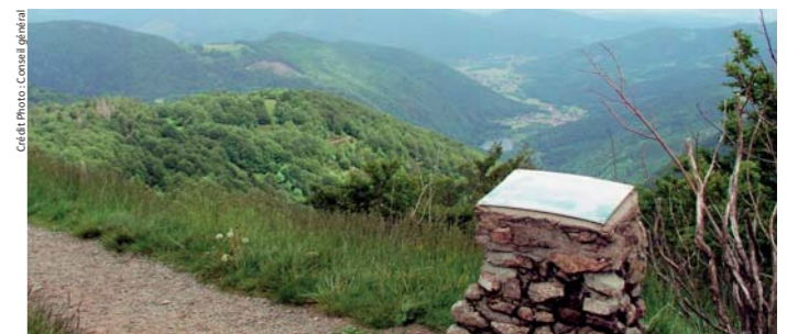
Sentier des découvertes