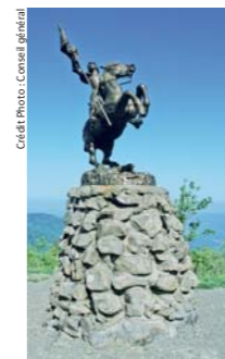
Statue de Jeanne D'Arc

Lorsqu'il aperçut les lumières de sa ferme il se promit d'ériger une statue à la Vierge.